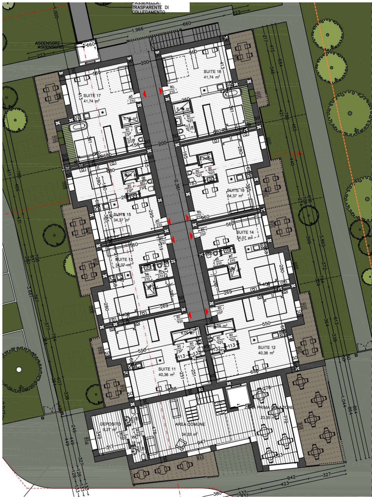
Figura 3: Pianta piano primo - Corpo A