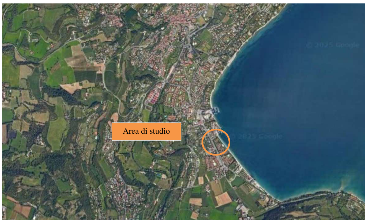
Figura 1: Individuazione del lotto

L'intervento in oggetto riguarda la realizzazione di un nuovo edificio ricettivo presso via Marconi a Padenghe sul Garda (BS) all'interno del progetto variante SUAP "Concentra Cross n°1/2008 del 28/05/2010 per la realizzazione di un Hotel 4 stelle.