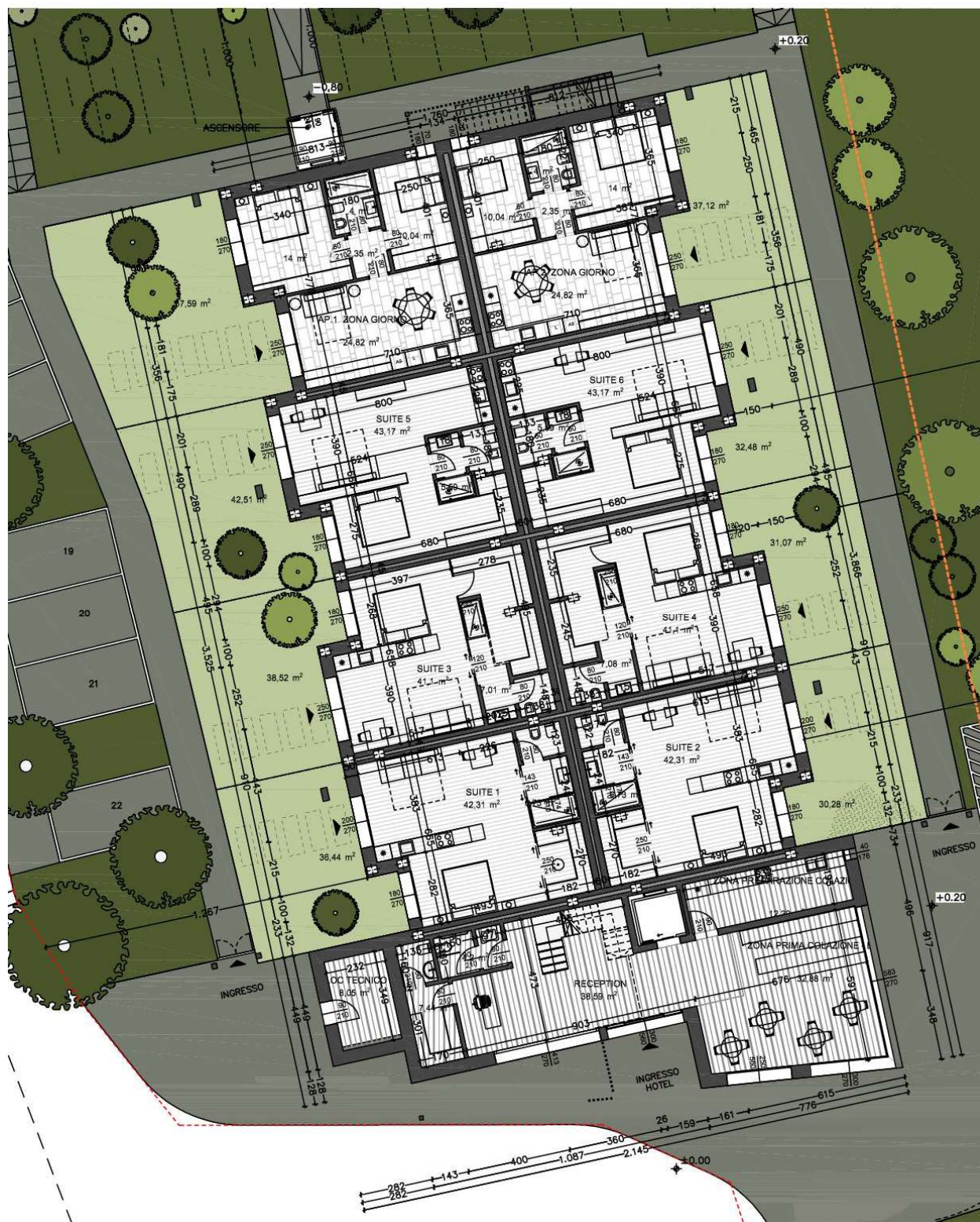
Figura 2: Pianta piano terra - Corpo A